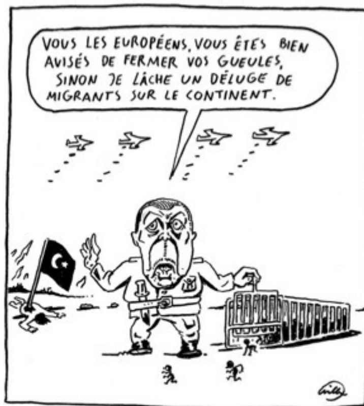
Dessin de Willem pour Libération