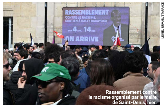
Rassemblement contre le racisme organisé par le maire de Saint-Denis, hier.