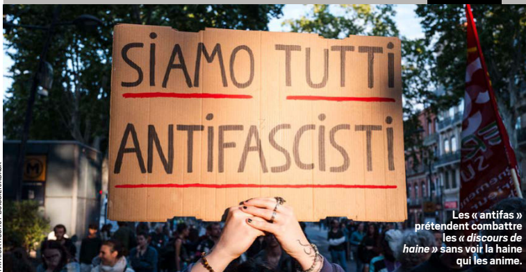
Les « antifas » prétendent combattre les « discours de haine » sans voir la haine qui les anime.