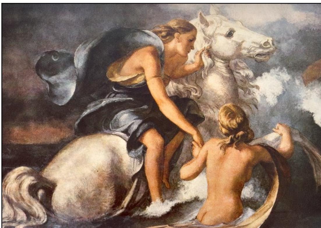
Thétis par Hans Hopp