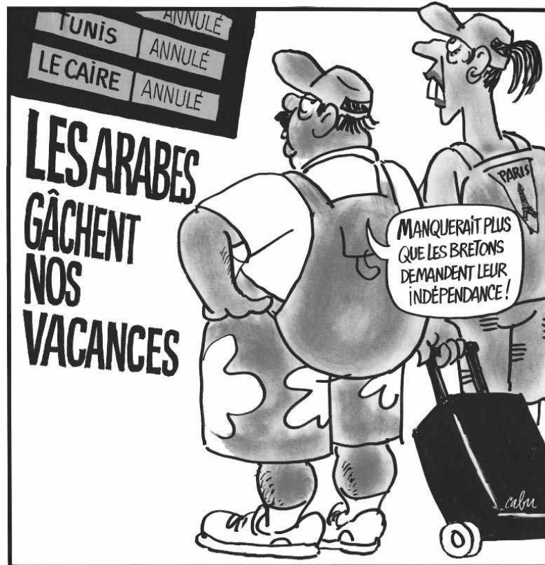
Dessin de Cabu