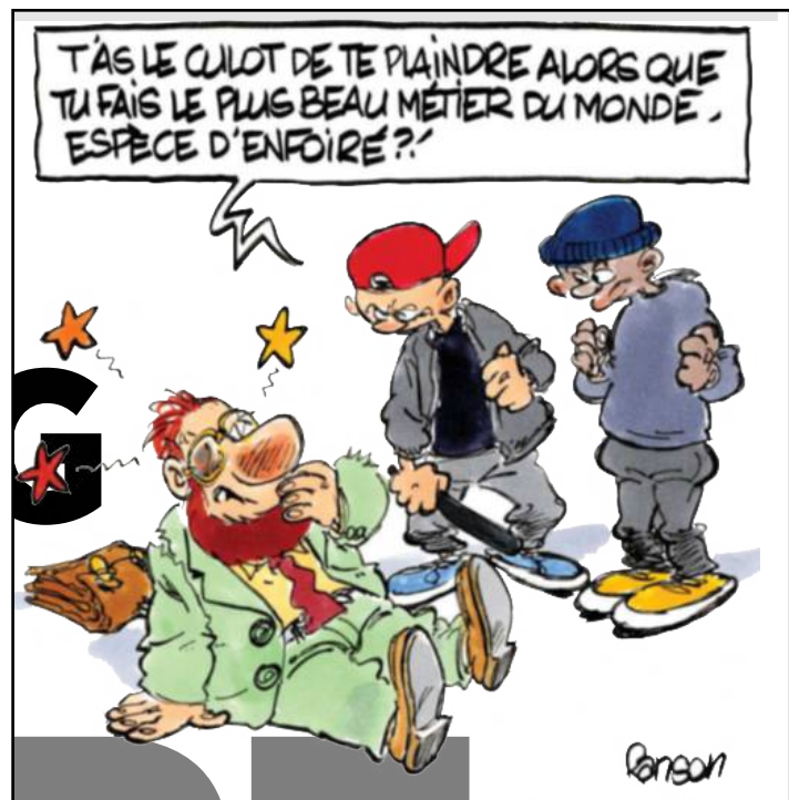
Dessin de Ranson pour Le Parisien